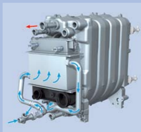
échangeur en inox associé au corps de chauffe légendaire en fonte Buderus